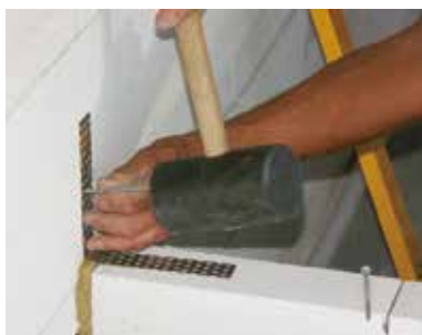
Dodatočná montáž murivovej spojky