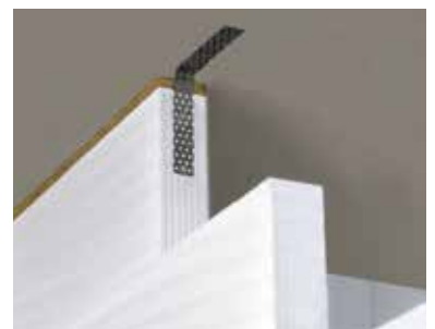
Ukotvenie k stropnej konštrukcii