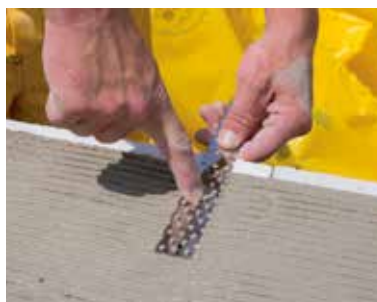
Priebežné vkladanie murivovej spojky do ložnej škáry